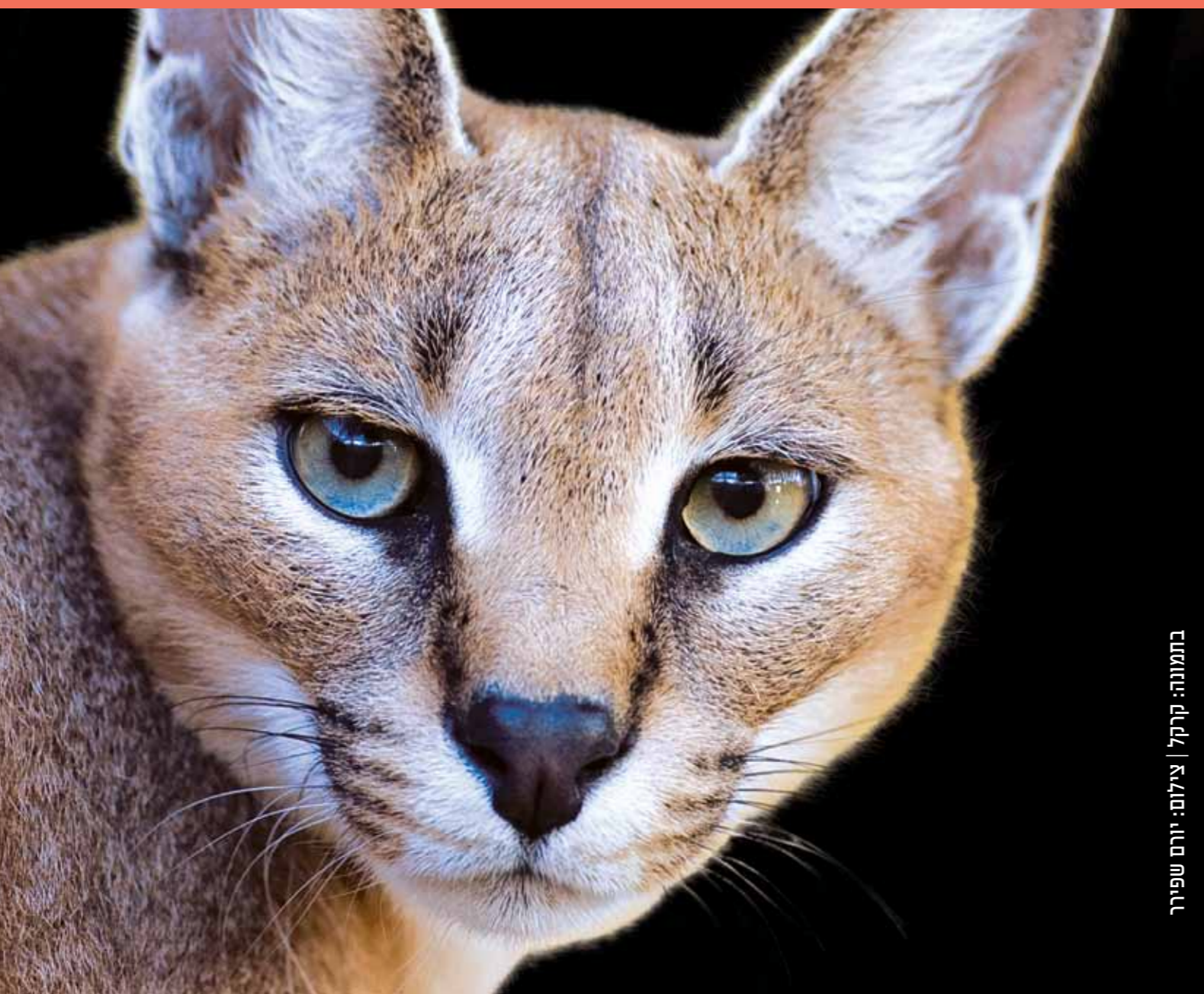
בתמונה: קרקל